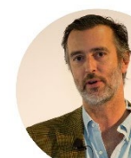
João Cotrim de Figueiredo