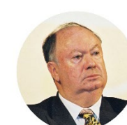
Alberto João Jardim